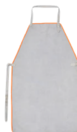
AVENTAL RASPA AÇOUGUEIRO