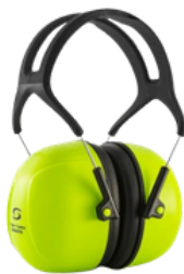
ABAFADOR SS 24 Db