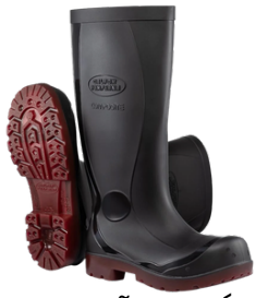
PROTEÇÃO QUÍMICA E ELÉTRICA