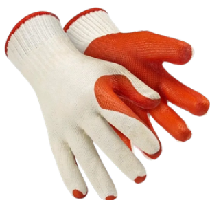
RUBBER LATEX CA34.370