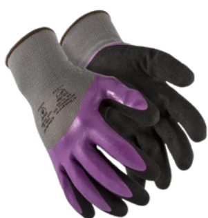
NITROMAX ¾ NITRÍLICO CA 42.283