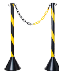
PEDESTAL E CORRENTE