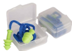
PROTETOR PLUG CORDÃO