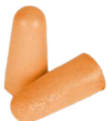
PROTETOR FOAM SEM CORDÃO