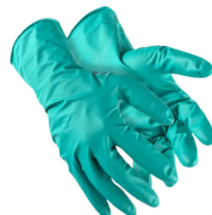
SUPERGLOVE NITRO NITRÍLICO CA 38.011