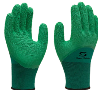
1009 LÁTEX CA 31.895