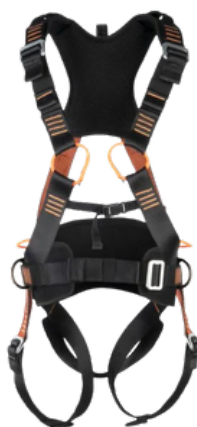
CINTO 4 PONTOS