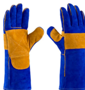
SUPERWELD CA 39.333