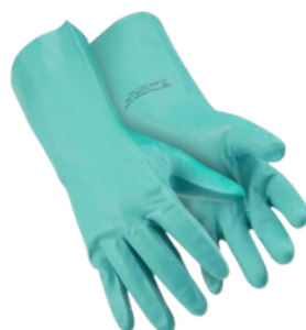
GLOVEMAX NITRÍLICO CA43.407