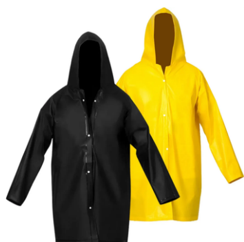
CAPA DE CHUVA