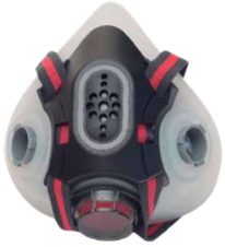
SEMI FACIAL ELASTÔMERO