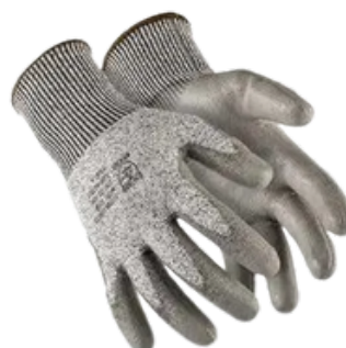
1008 PU CA 32.036