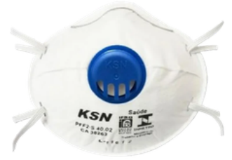
RESP. IND. DESC.