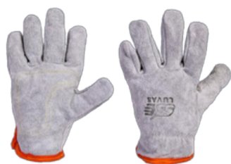
LUVA DE RASPA