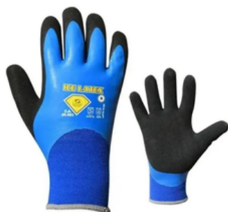
ICE LATEX CA 43.440