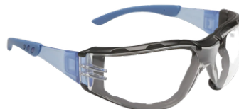
ÓCULOS AR / AE