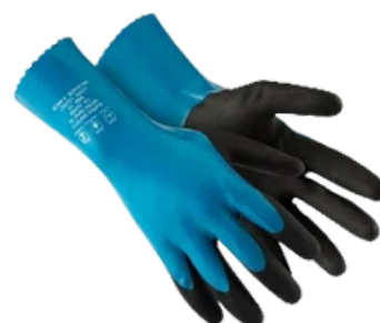
NITROMAX 5 CA 42.285