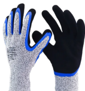
1007 N NITRÍLICO CA 32.039