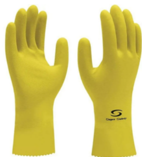
SILVER LÁTEX CA 33.332