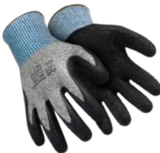
SS1010 LÁTEX CA 31.896