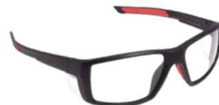
ARMAÇÃO ÓCULOS GRAU