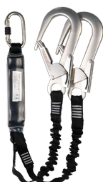
TALABARTE Y GANCHO ALUM.