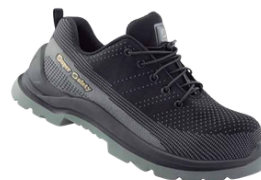
TÊNIS COM BIQUEIRA