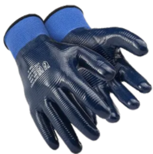
1002L NITRÍLICO CA 49.434