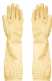
SUPERMIX LÁTEX LÁTEX CA 37.158