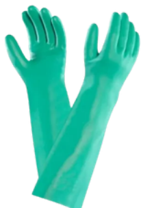
SUPER GREEN/ NITRILE LONG CA 40.506