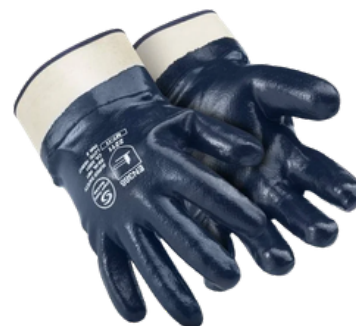
1001 NITRÍLICO CA 49.538