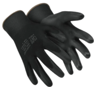
1003 PU CA 32.034