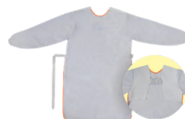
AVENTAL RASPA BARBEIRO