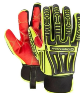
SS TURTLE CA 48.280