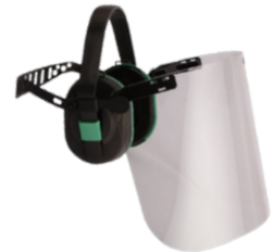
KIT AUDITIVO E FACIAL