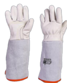
LUVA DE VAQUETA