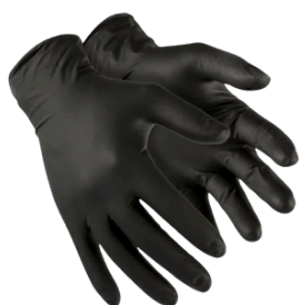
GLOVE SKIN NITRÍLICO CA 38.645