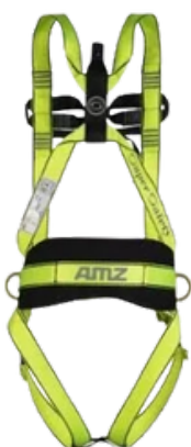
CINTO 2 PONTOS