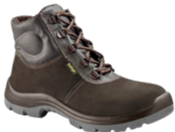
BOTINA AMARRAR CANO ALTO NOBUCK