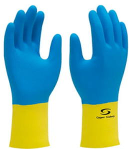
SUPERMIX NEOPRENE CA 33.333