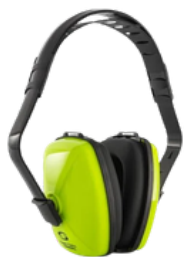
ABAFADOR SS 18 Db