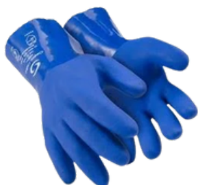
SUPER PVC CA 48.280