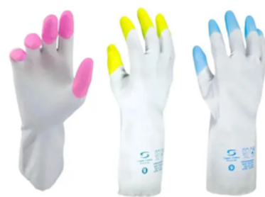
HOUSE HOLD LÁTEX CA 45.652