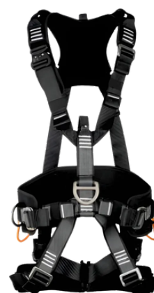
CINTO 5 PONTOS