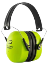
ABAFADOR SS 21 Db