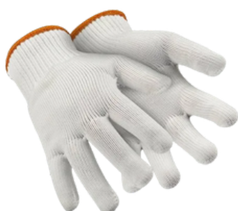
THERMAL CA 37.317