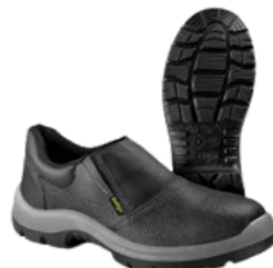
SAPATO PVC / COMPOSITE