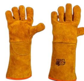
LUVA RASPA FORRADA IGNOFUGADA