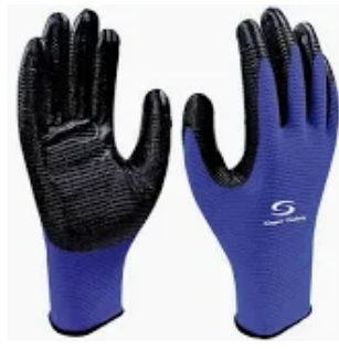
1006 N NITRÍLICA CA 41.076