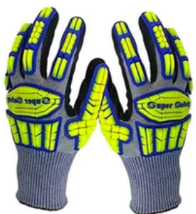
IMPACT NITRÍLICO CA 43.978