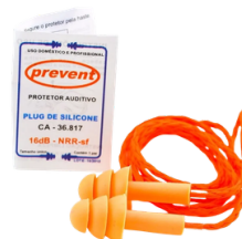
PROTETOR PLUG 16 / 18 DB