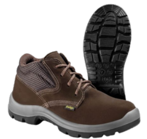
BOTINA AMARRAR NOBUCK