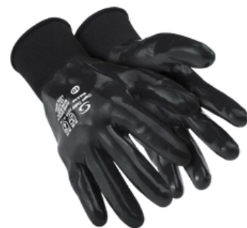
NITRO BLACK NITRÍLICO CA 41.507