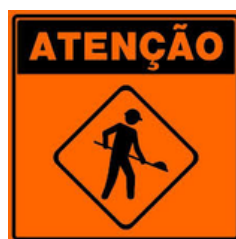
PLACAS DE VIAS