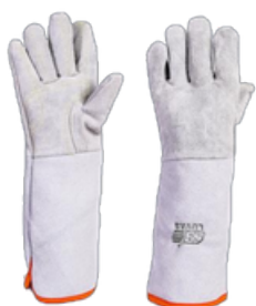
LUVA DE RASPA