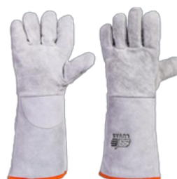
LUVA RASPA FORRADA