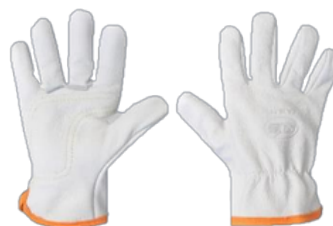
LUVA DE VAQUETA