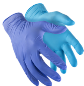
SUPER NITRIL LIGHT NITRÍLICO CA 37.871