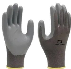
1006 NITRÍLICA CA 32.038