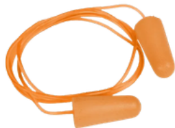
PROTETOR FOAM CORDÃO