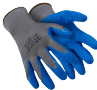
1005 LÁTEX CA 32.035