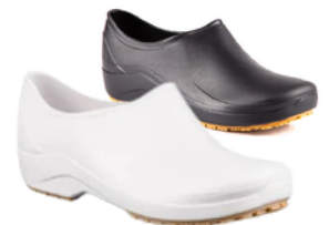
SAPATO GRIP INDUSTRIAL