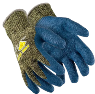
FIRE FLEX ARAMIDA CA 45.154