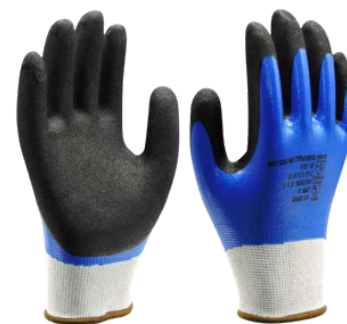
1014 NITRÍLICO CA 38.646