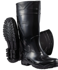
CONSTRUÇÃO CIVIL E SERVIÇOS GERAIS