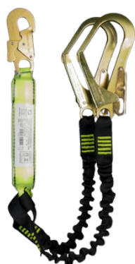
TALABARTE Y GANCHO AÇO