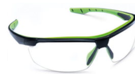
ÓCULOS AR / AE