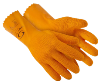
SUPER ORANGE LÁTEX CA 37.778